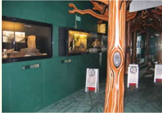
De Tuin van Toen naar Tegenwoordig

In de 'Tuin van Toen naar Tegenwoordig' komt u als bezoeker in een schaars verlichte kamer vol sprekende bomen en ervaar hier aan den lijve