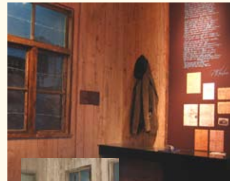
Deportatiekamer bestaand uit authentieke barakdelen

In een klein kamertje, waarvan je zelfs stil wordt door de beklemmende sfeer die het